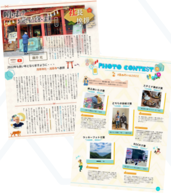
▲1月号社長挨拶 (左) と9月号フォトコンテスト (右) の記事

末永 直近になりますが、九月号のフォト・ムービーコンテストは良い企画だったかなと思います。社員を巻き込んだ企画の中でも、特にそれぞれの個性が出るというか、アゴラの雰囲気の記事から伝わってくるのかなと。