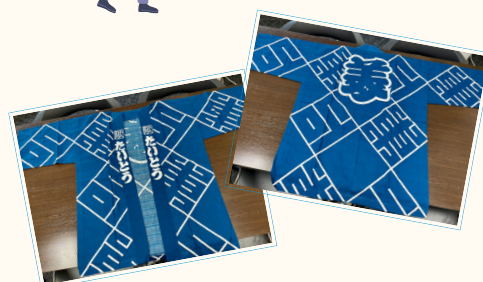
▲大江戸清掃隊の半てん写真