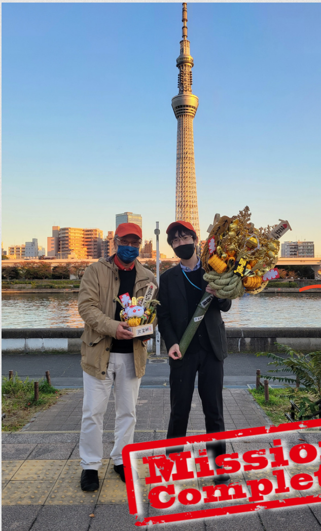
▲隅田公園でスカイツリーをバックに記念撮影しました！

また、縁起熊手を交換するという行為も初めてで、とても新鮮な気分を味わいました。改めて、 会社の一員である と実感しました。