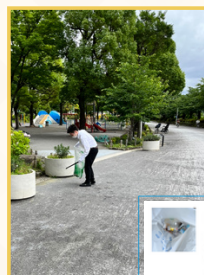
◀◀ごみ拾い活動と活動報告(ピリカ)の様子