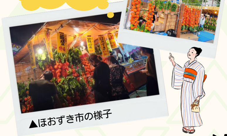
▲ほおずき市の様子

浅草寺では、毎年7月9日・10日は、「四万六千日」の縁日とされており、縁日にもなつてほおずき市が開催されています。浅草寺境内を彩るほおずきの屋台は、浅草の夏の風物詩です。