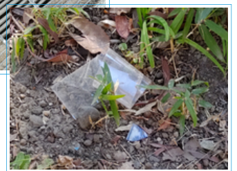
▲ゴミ拾い活動中に撮影した写真